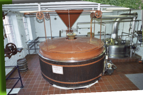
Brasserie du Roeulx

R.V.10H30 PLACE DU ROEULX (SORTIE 21 SUR LA E19 VERS MONS)