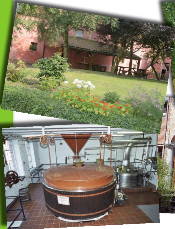
Brasserie du Roeulx

R.V.10H30 PLACE DU ROEULX (SORTIE 21 SUR LA E19 VERS MONS)